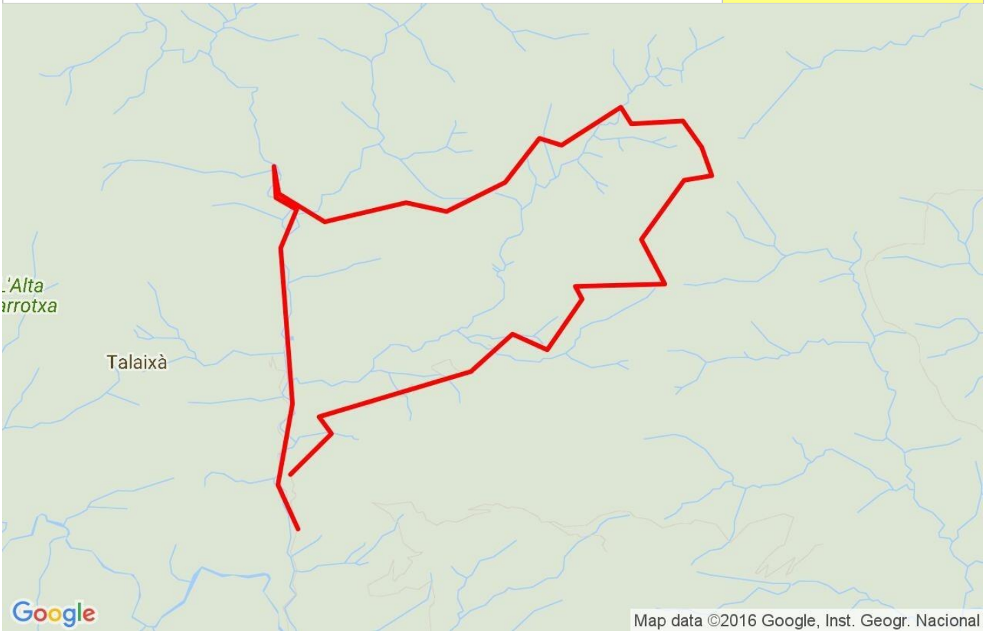
Map data ©2016 Google, Inst. Geogr. Nacional